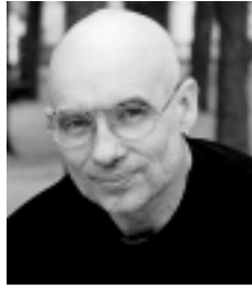
Dennis Russell Davies

Wohl kein anderer Aufführungsort ist für Anton Bruckners Achte Symphonie adäquater als die Stiftsbasilika von St. Florian. Dennis Russell Davies stellt sich mit diesem Konzert nicht nur dem Stiftskonzert-Publikum als neuer Chefdirigent des Bruckner Orchesters Linz vor. Für ihn ist es auch das erste Dirigat über der Grabstätte des Komponisten.