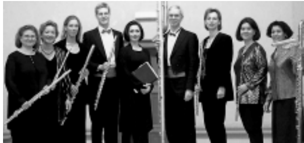
Julia Stemberger und die Vienna Flautists

Von der Piccolo- bis zur Bassflöte reicht das Instrumentarium der Vienna Flautists . Ein buntes Programm von Bearbeitungen für diese seltene Besetzung wird literarisch gewürzt durch die erfolgreiche Schauspielerin Julia Stemberger ein Konzert wieder einmal im Brocktheater des Stiftes Lambach.