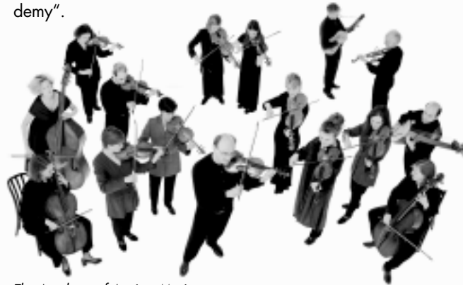
The Academy of Ancient Music

zwei Brandenburgische Konzerte von J. S. Bach musizieren. Nach der Aufführung aller sechs Brandenburgischen Konzerte vor zwei Jahren mit modernen Instrumenten können Sie nun einen interessanten Vergleich ziehen mit den Originalinstrumenten der „Academy“.